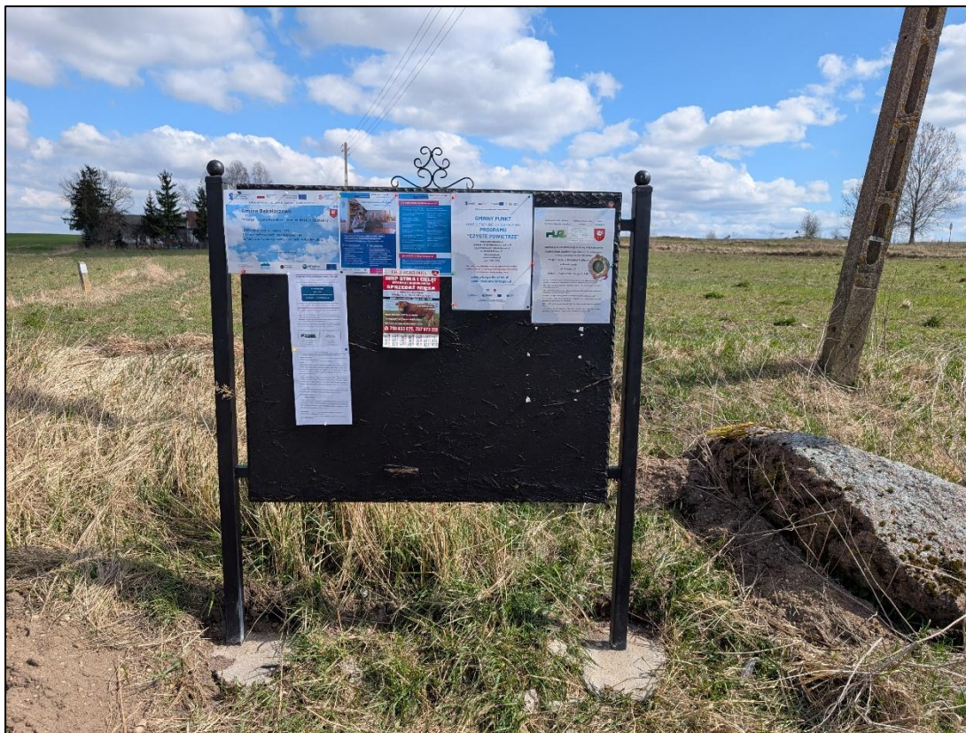
g. Tablica ogłoszeń wsi Kamionka Poprzeczna