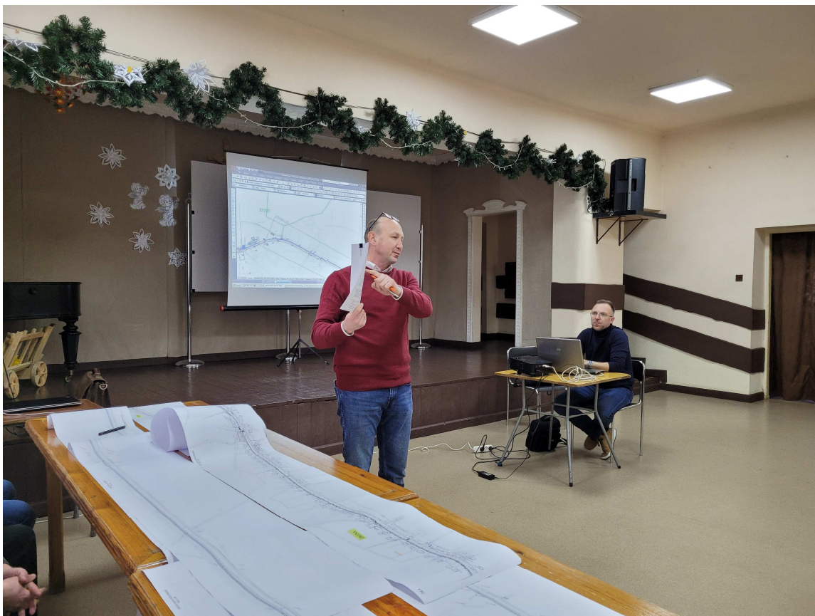
Spotkanie konsultacyjne 26.01.2023r. w Zbójnej: